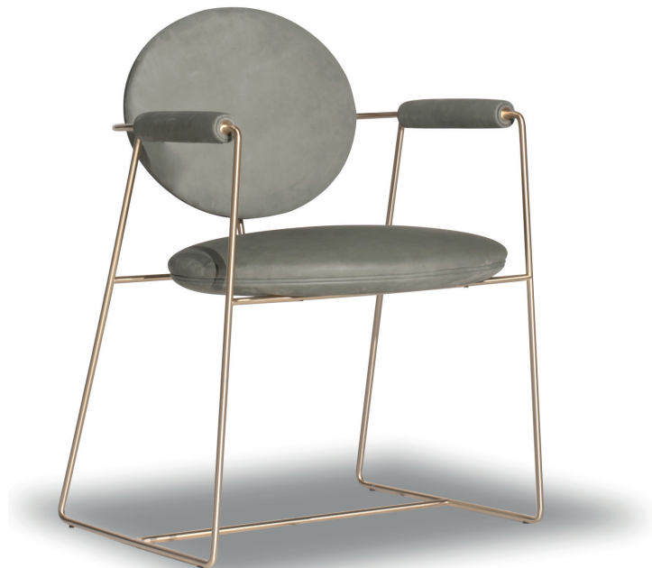
Kashmir Mousse | b. ottonata, brassed

Struttura in tondino di metallo da 1,2 cm, 1/2" ottonato satinato, brunito spazzolato a mano o nichelato satinato, con vernice opaca . Struttura seduta e schienale in multistrato di faggio, struttura braccioli in massello di faggio. Imbottitura in poliuretano espanso con rivestimento in fibra acrilica. Profilo decorativo nella medesima tonalità di cuoio.